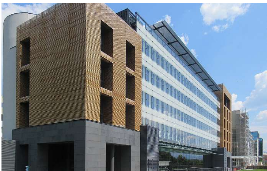
2016-2020 -Ristrutturazione degli Allianz Headquarters a Trieste