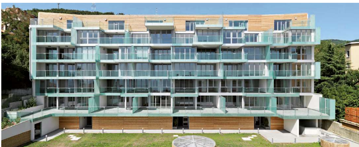
2003-2009 - "Riflessi" Complesso residenziale