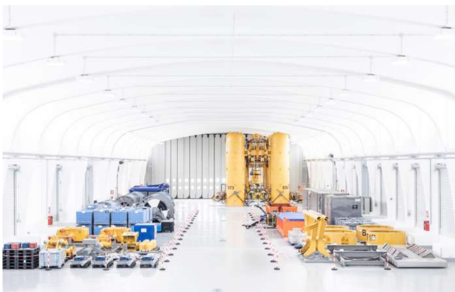
2016 - Restauro del Magazzino 23 in Porto Vecchio a Trieste, nuovo centro della robotica sottomarina di Saipem