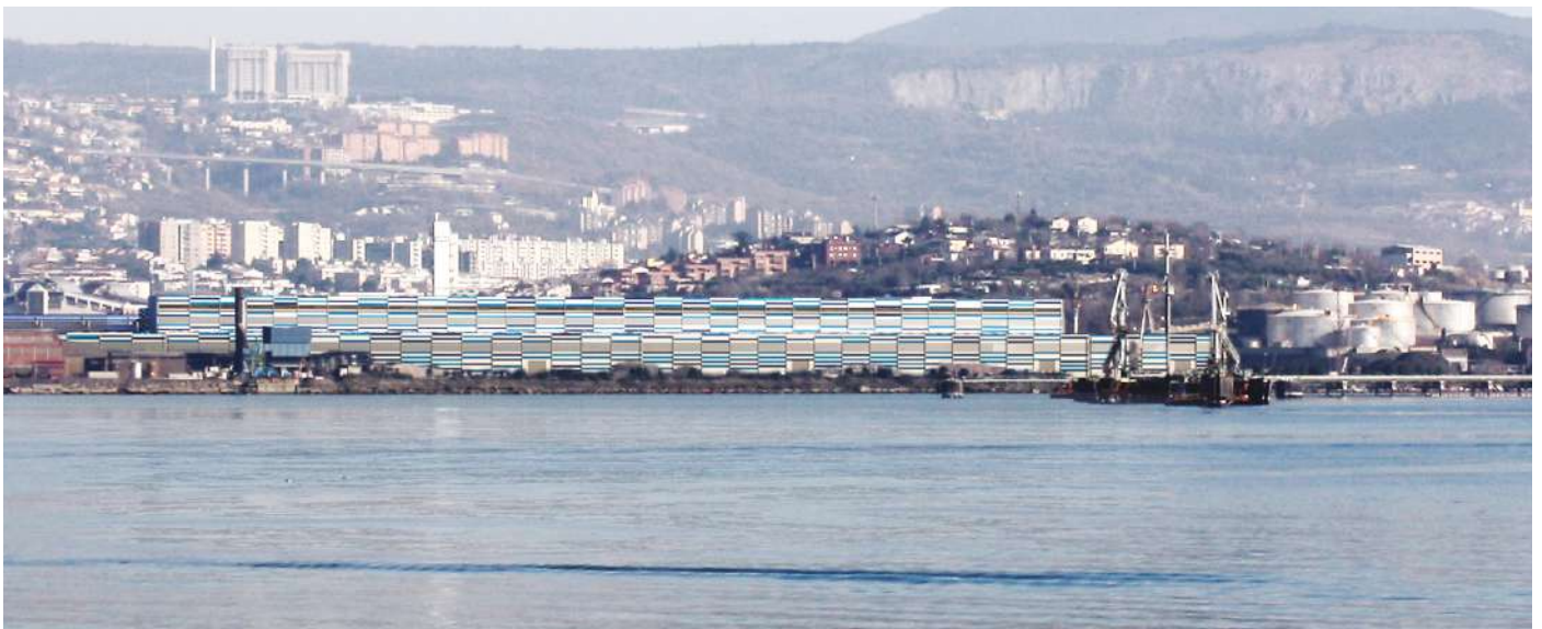
2021 - Ampliamento del nuovo laminatoio a freddo di Siderurgica Triestina, Gruppo Arvedi.